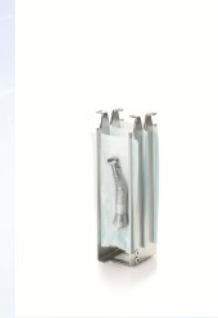
Paketli enstrümanlar için paket tutucu (Material Nr: 00126)