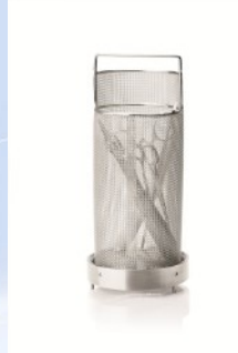
Universal sepet... (Material Nr: 00125)