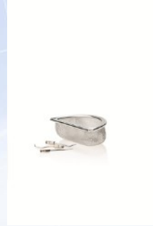
...Universal sepet için küçk par aparati (Material Nr: 00125)