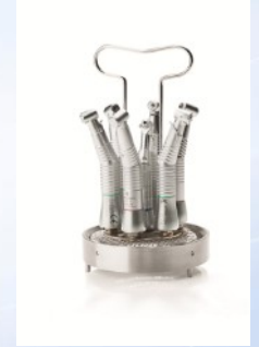
ISO adaptörlü destekli turucu (Material Nr: 00122)